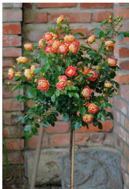
'Bienenweide mango'

Für Rosenbögen, Duftgärten oder Pavillons eignet sich die Kletterrose 'Divina', für die sich Rosen Tantau über Auszeichnungen für ihren fantastischen Duft in Saverne, Barcelona und Paris freuen kann. „Diese Rose schenkt einen subtilen blumigen Duft von Rose und Geranie, aber vor allem erfrischt sie durch Bergamotte- und Eisenkraut-Noten, unterstützt von einem Hauch schwarzer Johannisbeere. Ihr Duft erinnere, an frisch gewaschene Wäsche“, heißt es in einer ihrer Bewertungen aus Paris. 'Divina' wurde als ADR-Rose ausgezeichnet und zeigt sich mit hellgrünem Laub, das sehr gut mit dem Rosé der duftenden Blüten harmoniert. Kompaktbuschig wächst die Beetrose 'Spotlight' aus dem Züchterhaus Kordes Rosen. Mit ihren gefüllten Blütenchalen in reichen Dolden und einer kräftig gelben Blütenfarbe gewann sie im vergangenen Jahr gleich zwei Rosen-Neuheiten-Wettbewerbe, in Paris und in Baden-Baden. Dank ihres gedrunge- nen Wuchscharakters ist die Beetrose sehr gut geeignet für die Verwendung in Pflanzgefäßen auf Terrasse und Balkon. Darüber hinaus zeigt sie eine hohe Blattgesundheit und eine gute Hitzetoleranz der Blüten. Rosen - perfekt im Topf