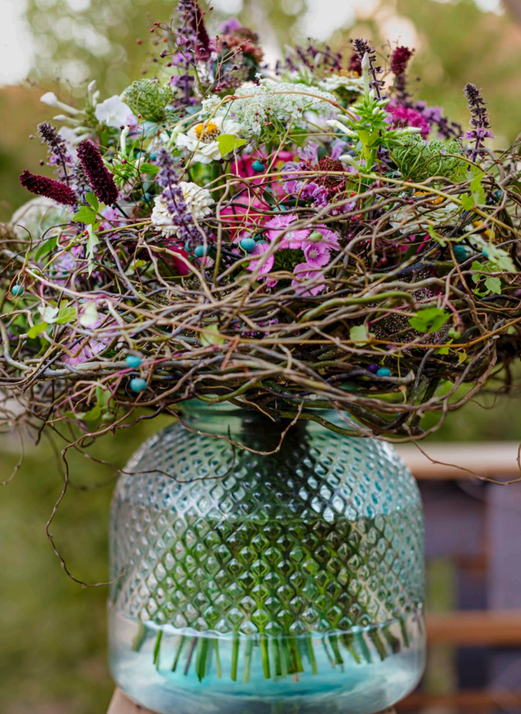
Ein klassischer Sommerstrauch in bauchiger Vase: Freilandrosen sind die Basis für die leichter wirkenden Blüten des Sommerstaudenschnitts.

Freilandrosen passen auch hervorragend in Werkstücke mit Sommerstaudenschnitt. Ein gutes Beispiel ist der klassische Sommerstrauch in einer bauchigen Vase, umwunden mit Korkenzieher. Die Rosen bilden die kompakte Basis für die leichter wirkenden Blüten etwa von Skabiosen, Bartnelken, Phlox oder Basilikumblüten. Ein naturhaftes Werkstück, eine Blumenauswahl „quer durch den Garten“ wie Sarah Hasenhündl sagt – oder dem Sommerangebot eines BGM entsprechend.